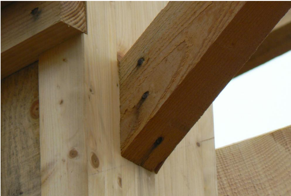
Assemblage par clouage de contreventement