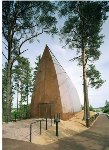
▲ Semblable à une hutte primitive, la chapelle dresse son pignon vers le ciel.

Édifiée pour le culte de différentes congrégations religieuses, la chapelle Saint Henry s'affranchit des dogmes pour tendre vers l'universel. D'apparence primitive par sa forme indécise, elle révèle à l'intérieur une puissance structurale mise au service du sacré.