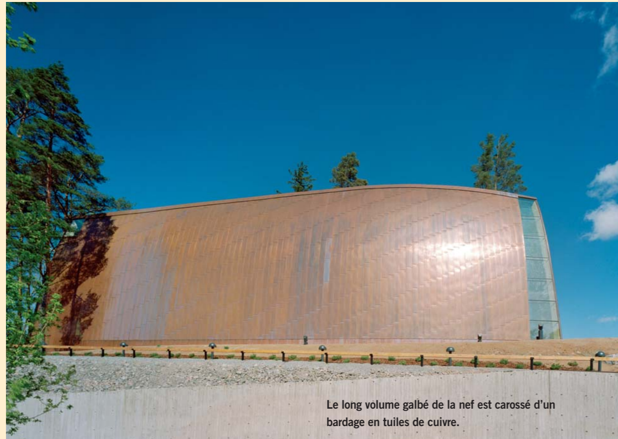
Le long volume galbé de la nef est carossé d'un bardage en tuiles de cuivre.

Cette chapelle s'inscrit dans la longue tradition finlandaise des églises en bois dont elle renouvelle l'approche architectonique. Juchée au sommet d'une colline, elle est située sur l'île d'Hirvensalo, en face de Turku, et s'impose d'emblée comme une énigmatique sculpture dans le paysage. D'aspect austère, le bâtiment se présente comme une étroite coque galbée, entièrement recouverte de cuivre à l'exception de deux bandeaux vitrés à l'une des extrémités. L'image d'une grande barque retournée, à la proue tronquée, vient naturellement à l'esprit du visiteur qui retrouve ainsi la symbolique initiale du projet. Selon l'architecte lui-même, les premières esquisses sont directement inspirées de la forme du poisson, signe de reconnaissance des premiers chrétiens et du bateau, comme expression d'une communauté se dirigeant vers un même but. L'enveloppe à courbure variable, dont le faîtage s'infléchit doucement produit une forme libre, organique que renforce le dessin des